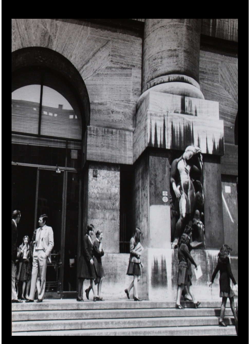
Left: Palazzo Mezzanotte