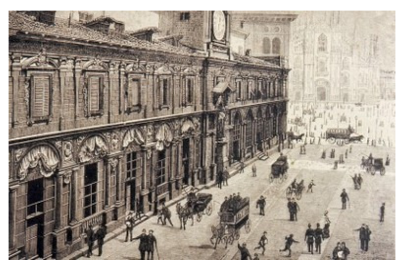
With the constant development of financial operations Palazzo Broggi became inadeguate. The new project was assigned to the Architect Palazzo Mezzanotte.

The impressive building of Palazzo Mezzanotte was celebrated in front of the Duce Benito Mussolini in 1932. It demostrates the vivid interest of the Fascism for the new Italian Stock Exchange building. Its rationalistic traits still triumph over Piazza degli Affari square.