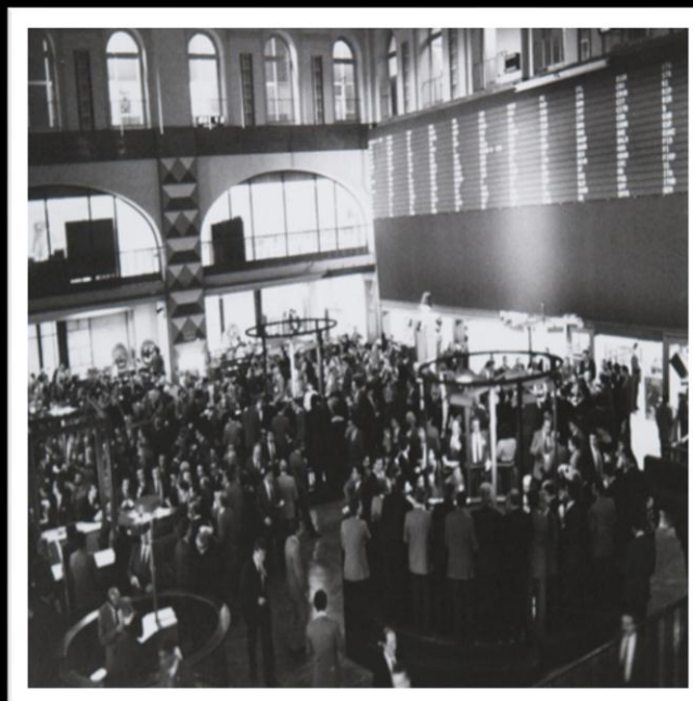
Palazzo Mezzanotte Sala delle Grida , anni '60

Le contrattazioni a Palazzo Mezzanotte nella Sala delle Grida