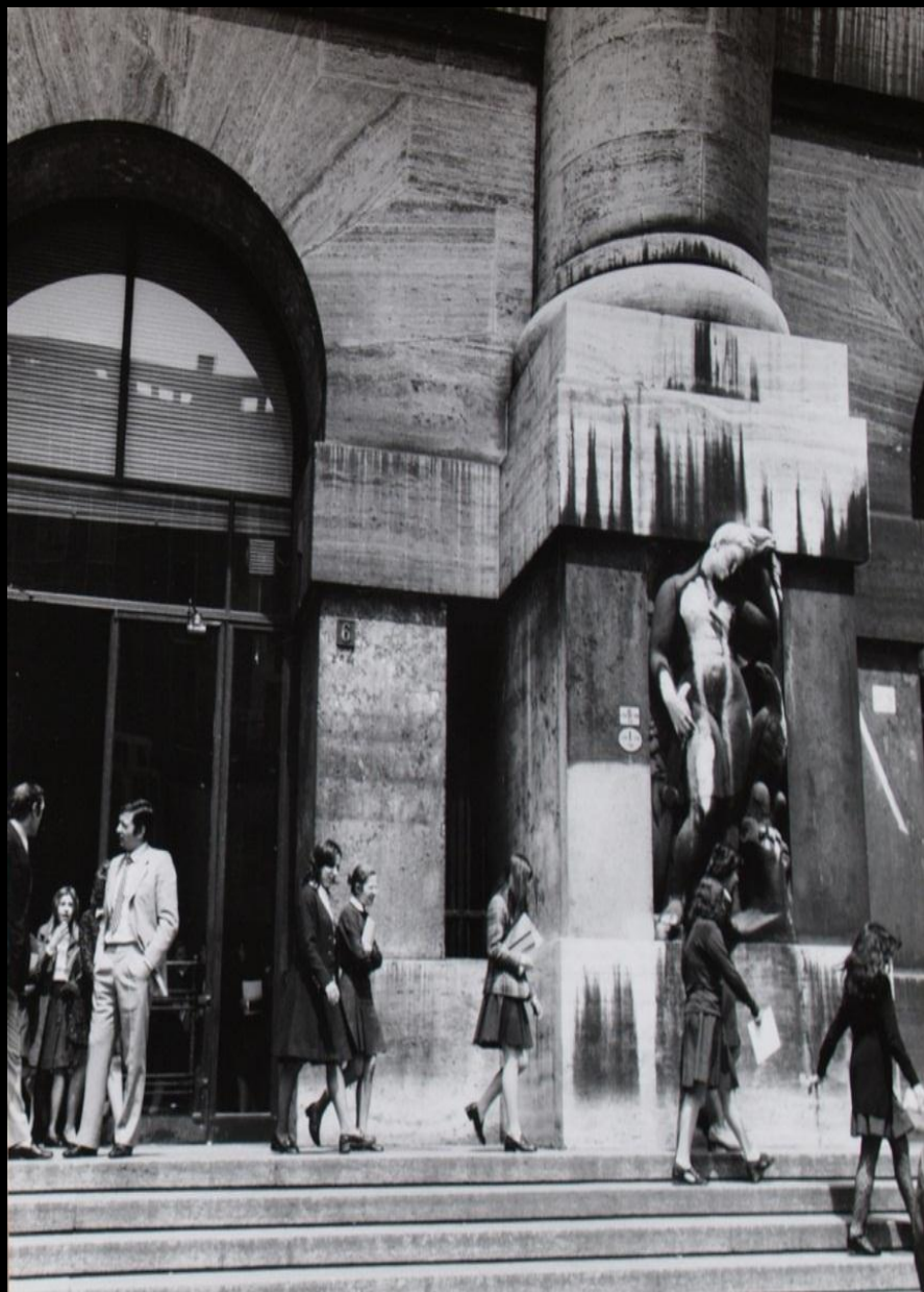
A Sinistra Palazzo Mezzanotte

L'ingresso della Borsa Valori di Milano negli anni '60.