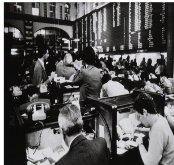
A fianco Palazzo Mezzanotte

Centro meccanografico della Sala delle Grida fine anni '60.